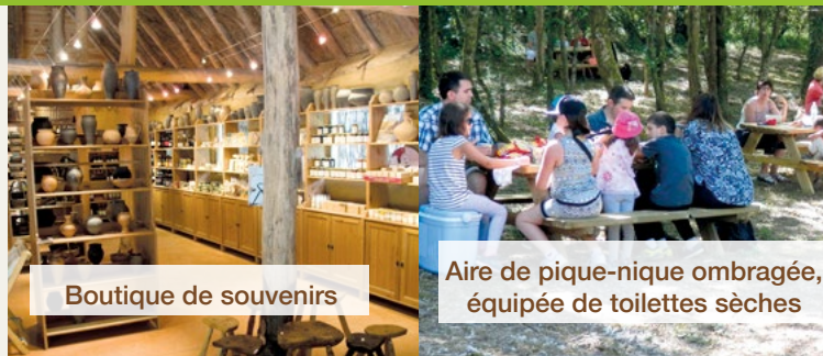
Boutique de souvenirs