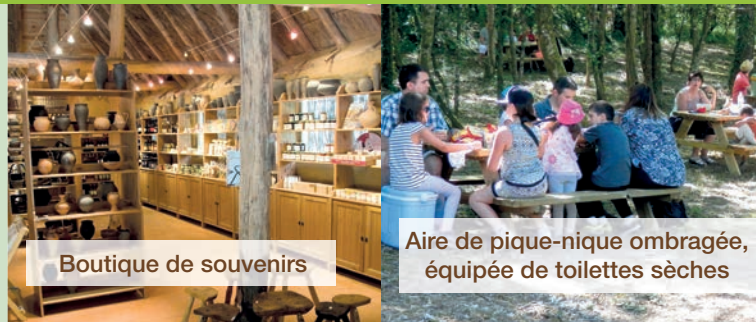
Boutique de souvenirs

Nous pouvons vous proposer des activités sur mesure, des challenges : tir à l'arc, parcours d'orientation,... Notre équipe se tient disponible pour vous aider à construire votre programme.