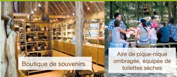
Boutique de souvenirs